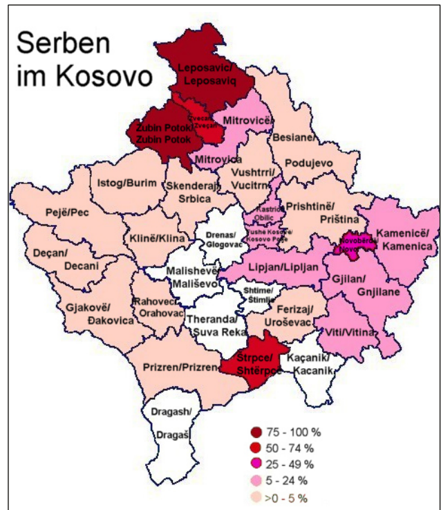
Répartition des Serbes au Kosovo selon le Rapport 2005 de l'OSCE.

Et ce n'est pas tout: mécontents du contenu des statuts, les membres du gouvernement de