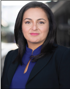
Sevim Dagdelen.

(Red.) Unter dem Motto «Den Frieden und die Zukunft gewinnen, nicht den Krieg» hat das Kölner Friedensforum am 1. September 2023 zu einer Diskussionsveranstaltung eingeladen.