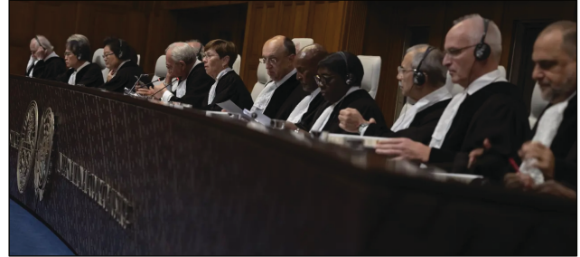
Les juges de la Cour internationale de justice (CIJ) lors du prononcé du verdict dans le procès pour génocide contre Israël à La Haye, Pays-Bas, le 26 janvier 2024.

* Professeur à l'Université de Columbia, est directeur du Centre pour le développement durable de l'Université de Columbia et président du Réseau des solutions de développement durable des Nations Unies. Il a été conseiller auprès de trois secrétaires généraux de l'ONU et occupe actuellement la fonction de défenseur des ODD auprès du secrétaire général António Guterres.