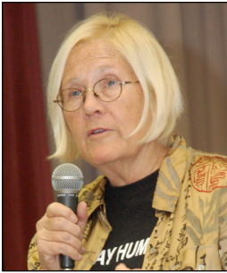
Ann Wright.

Während die Vereinigten Staaten ihre militärische Konfrontation mit China durch neue Militärstützpunkte auf Guam und den Philippinen sowie durch weitere Land-, See- und Luftübungen mit Ländern im asiatisch-pazifischen Raum verstärken, finden vom 26. Juni bis zum 2. August 2024 im mittleren Pazifik die weltweit grössten Seekriegsübungen statt – und die Nato ist mittendrin.