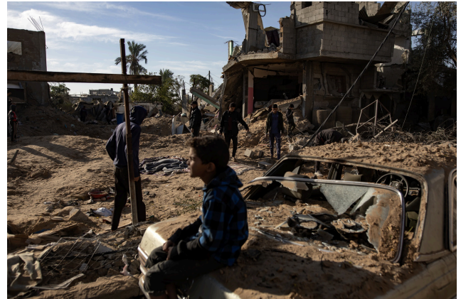
Palästinenser inspizieren die Überreste zerstörter Gebäude nach den israelischen Luftangriffen in Khan Younis im südlichen Gazastreifen am 25. Oktober 2024.