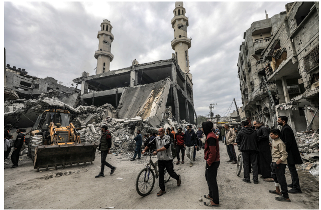
Palästinenser versammeln sich am 27. November 2024 am Ort der Al-Qassam-Moschee, die bei einem nächtlichen israelischen Luftangriff auf das Flüchtlingslager Al-Nuseirat im mittleren Gazastreifen zerstört wurde.

Die UN-Generalversammlung hat frühzeitig im Rahmen ihrer Beschlüsse zum Selbstbestimmungsrecht der Völker die enge Verwandtschaft zwischen dem südafrikanischen und palästinensischen Fall betont. So bestätigte sie zum Beispiel in ihrer berühmten Resolution 2649 (XXV) vom 30. November 1970 «die Legitimität des Kampfes der Völker unter kolonialer und rassistischer Herrschaft, denen das Recht auf Selbstbestimmung zuerkannt wird, um ihre Rechte mit al-