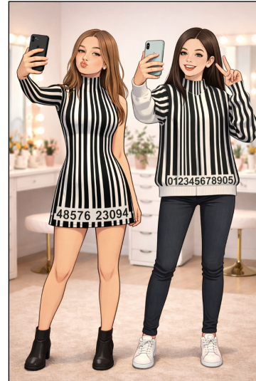
Mädchen als Produkt?

rige (eigentlich eignen sie sich für niemanden), da herrscht weitgehend Konsens.