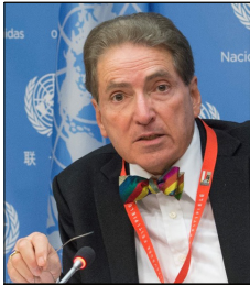
Alfred de Zayas.

Ein unvoreingenommener Beobachter, der beurteilen möchte, wie sich Länder zu grundlegenden Fragen der Menschenrechte, des Völkerrechts, des Friedens, der Entwicklung und des Multilateralismus verhalten, braucht lediglich die Abstimmungsergebnisse der Staaten im Sicherheitsrat der Vereinten Nationen, in der Generalversammlung, im Menschenrechtsrat und in anderen internationalen Gremien zu betrachten.