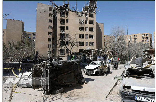
Zerstörungen in einem Stadtteil Teherans.

Abstimmung ergab 92 Ja-Stimmen, keine Nein-Stimmen und 34 Enthaltungen. Der kollektive Westen und seine Vasallen befanden sich in der dritten Kategorie. Im Jahr 2009 beauftragte der Menschenrechtsrat das Büro des Hohen Kommissars für Menschenrechte, einen Workshop zum Recht auf Frieden einzuberufen, an dem ich als einer der Experten teilnahm. 4 Wir erstellten einen aussagekräftigen Bericht. 5