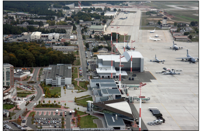
Base aérienne américaine de Ramstein.

Depuis des décennies, les gouvernements allemands réagissent à toutes les plaintes émanant du Parlement et de la société civile, qui reprochent à l'exécutif d'avoir commis des actes