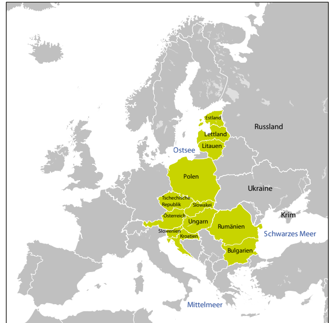
Intermarium-Staaten (grün)

Offensichtlich ging es um die Stärkung Polens und der baltischen Staaten. Vor allem aber dar-