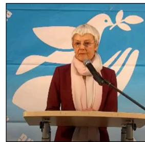
Prof. Gabriele Krone-Schmalz: «La démocratie ne fonctionne pas si les citoyens se dérobent.» (Capture d'écran d'un enregistrement)

Madame Krone-Schmalz, spécialiste de la Russie et ancienne correspondante de longue date de l'ARD, a commencé son exposé 1 en abordant le thème de la dictature de l'opinion et de la propagande unilatérale dans les médias, en politique et dans l'opinion publiée. Elle a cité entre autres comme exemple le terme «Kriegsmüdigkeit» (lassitude de la guerre). Selon elle, c'est une expression perverse pour qualifier la volonté de faire la paix.