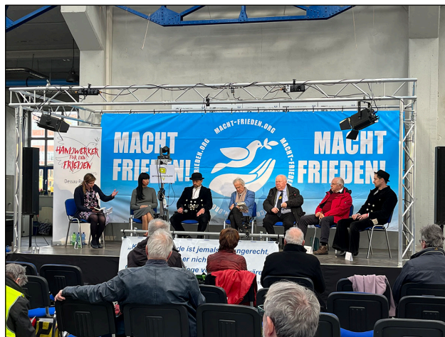
Des artisans et des militants pour la paix sur le podium.

Les discussions ont été animées dans trois forums et les résultats ont été présentés à la fin en séance plénière. La table ronde finale a été largement animée par des représentants des corporations et d'autres artisans. Ils ont parlé de leur engagement par des prises de position, des lettres incendiaires et l'organisation de manifestations, mais aussi des vents contraires qu'ils rencontrent dans les Chambres. 2 Mais, comme l'a