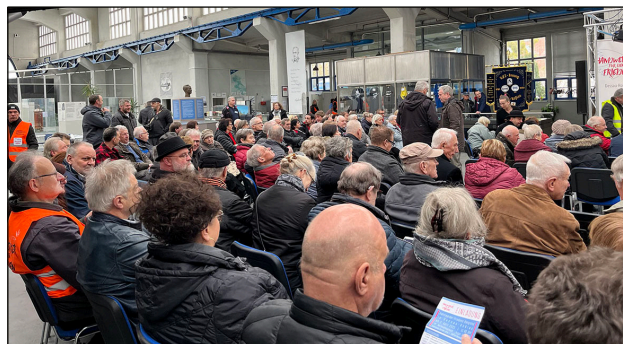
Des rangées pleines à craquer au musée technique «Hugo Junkers».

La protestation des artisans est très importante et encourageante. D'ailleurs, les gens de l'Est sont plus rebelles que ceux de l'Ouest. Nous ne sommes pas seuls, a-t-il expliqué, la majorité des gens dans le monde veulent la paix. Nous devons parler aux gens: Au travail, à la chorale de l'église, au club de sport, au syndicat. Parce que ce sont les gens qui font l'histoire, ce sont eux seuls qui peuvent provoquer des change-