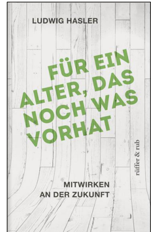
«Für ein Alter, das noch was vorhat – Mitwirken an der Zukunft», Verlag Ruffer & Rub, 2019 ISBN 978-3-906304-53-3

L'apprentissage est tout sauf une activité mécanique. Ce qui compte, ce sont moins les opérations intellectuelles individuelles que l'attitude personnelle. Par exemple, on a observé des élèves lors de la résolution d'un exercice de mathématiques et on a étudié les facteurs de réus-